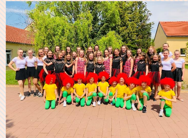
Kinder & Jugend