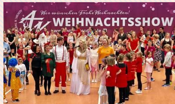
ATW - Weihnachtsshow